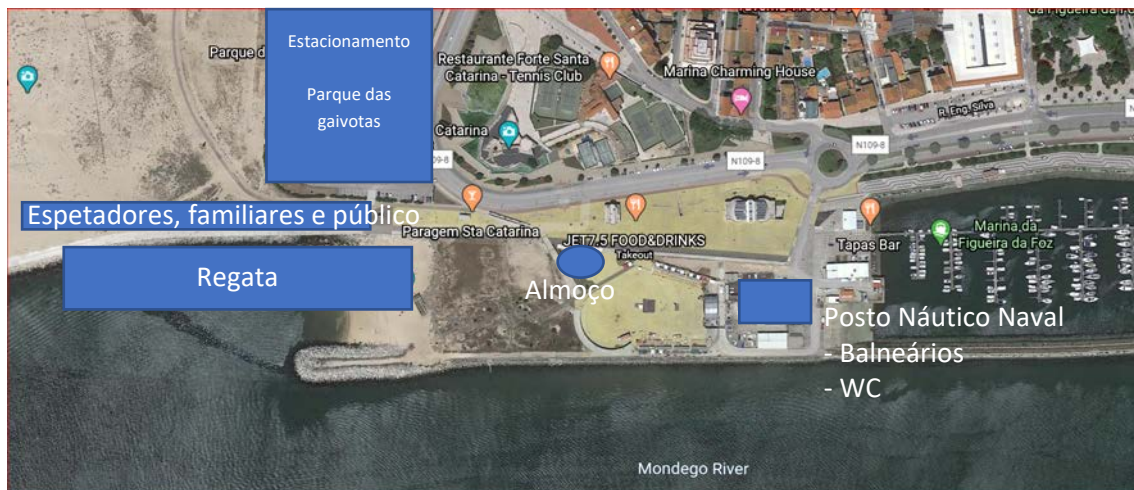
Figura 1 – Hot Spots